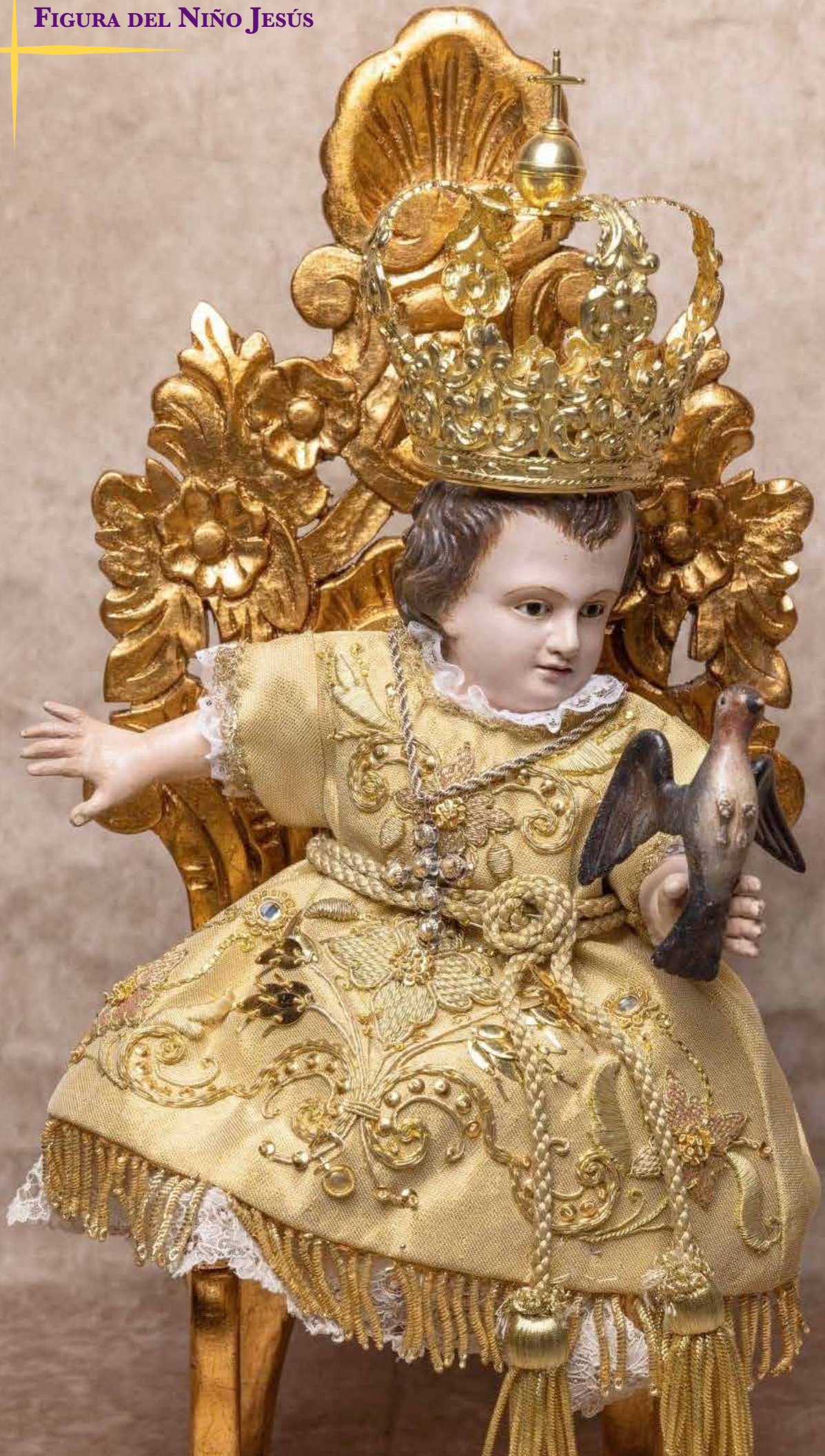
FIGURA DEL NIÑO JESÚS